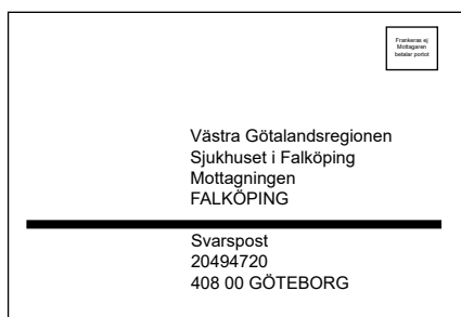
Kuvert för svarspost.

Svarspost används t ex vid utskick av patientenkäter och liknande. Patienterna/kunden skickar tillbaka sina svar i det bifogade svarspostkuvertet. Kuverten räknas hos PostNord och portokostnaden bygger på antalet kuvert som kommer tillbaka. Detta innebär en besparing jämfört med att sätta frimärken på alla kuvert. Kuvert eller etiketter för svarspost beställs på: regiontryckeriet.thn@vgregion.se .