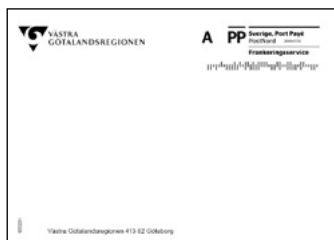
Etikett A6 Artikelnr. 200000000

För skrymmande brev och kuvert som saknar streckkod finns etiketter att beställa på Marknadsplatsen.