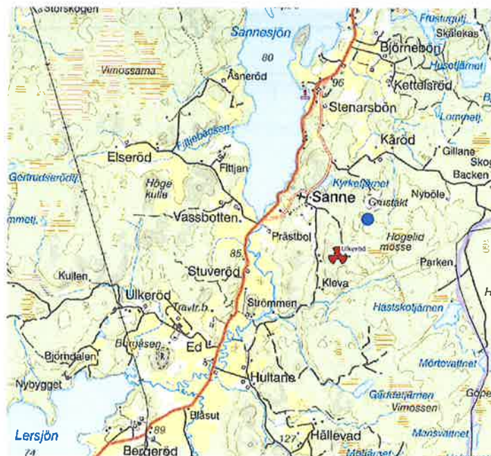
Alternativa mastplaceringar, andra kan komma i fråga

Förstudie om mobiltäckning Ulkeröd Juni 2021 av Thomas Björkstål