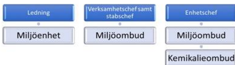
Figur 1 Beskrivning av Sjukhusen i västers miljöorganisation