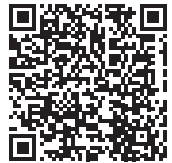
ንገዛእ ርእስኻ እትጽሕፈሉ መሰነይታ

ሕቶታት እንተ ኣልዩካ ወይ ክትዘራረብ እንተ ደሊኻ ምሳና ኸትራኸብ ትኸእል ኢኻ ።