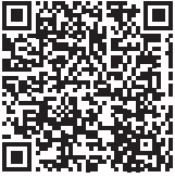
خطاب التحويل الشخصي

الرعاية الصحية المدرسية، عيادة الشباب، عيادة القابلة أو مركز الرعاية الصحية يمكن أن يقدموا لك المساعدة عن طريق كتابة خطاب تحويل الينا. بإمكانك أيضا أن تكتبي خطاب تحويل شخصي. ستعثرين على الاستمارة لخطاب التحويل الشخصي على موقع مستشفى أنجيريد على شبكة الإنترنت :Angereds närsjukhus webbplats