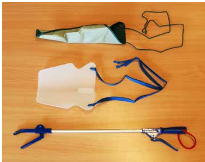
Hjälpmedel. Överst två sorters strump- pådragare. Nederst en griptång.