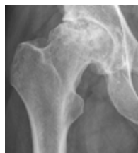
Höftled med artros.