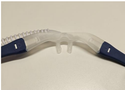
ljudnivå. Om patienten har behov av en ventrikelsond bör den helst