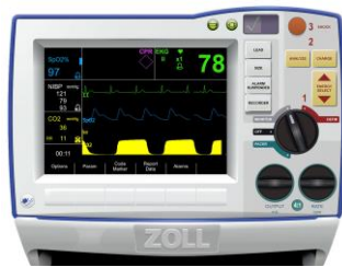
ZOLL R-series® ALS

Lifepak 20 defibrillator kommer att finnas på sal 86 på operation 8 och på sal 1 operation 1, och den kommer enbart användas för defibrillering med interna spatlar