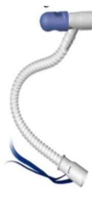
Fig. 2 Optiflow trakealkoppling