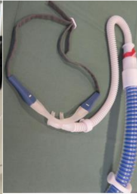
Fig. 1 Optiflow näsgrimma ansluten till blå inspirations slang