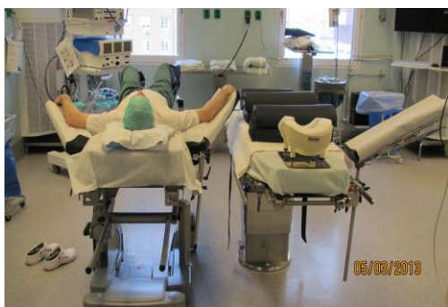
Vid vänstersidig sten

Hur står vi när vi vänder över till bukläge beror på om det är en vänster- eller högersidig sten, Var god se bilderna nedan.