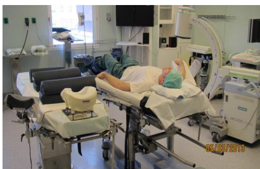
Vid högersidig sten