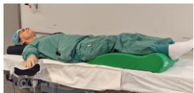
Venkudde till benen

Använd venkudde (Eswell leg positioning pad) för att avlasta för patientens hälar och ge bästa komfort om patienten har ont i rygg och ej kan ligga plant. Den ger patienten en "lawn chair position" och befrämjar det venösa återflödet och således cirkulationen samt avlastar hälar från tryck.