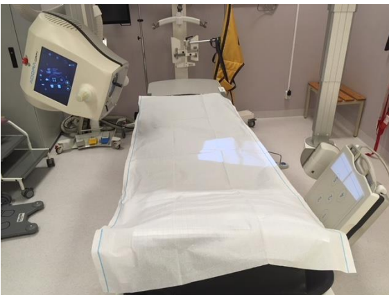
Position för höger höft