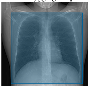
Serie 2. Ryggläge expiration