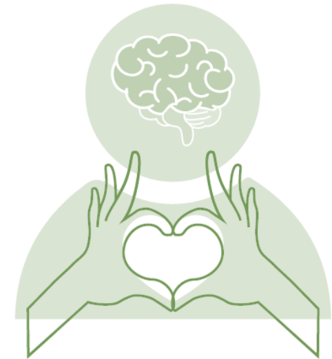
Fysisk hälsa vid psykisk ohälsa/sjukdom