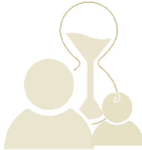
Tidiga samordnade insatser för att främja hälsa och förebygga ohälsa