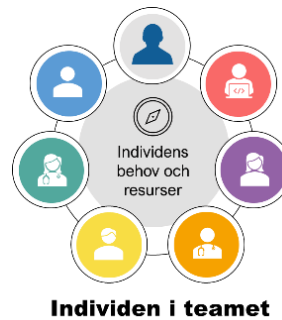
Figur 2 Aktiv medskapare i min egen vård, omsorg och skolgång

Det råder en förvirring kring SIPs syfte, användning och process. Den nya lagen om samverkan vid utskrivning från slutna hälso- och sjukvård har bidragit till detta. Psykiatri och delar av socialtjänsten har erfarenhet av att arbeta med SIP utifrån 2010 års lagstiftning och ska nu implementera arbetssättet från 2018 års lagstiftning. Flera verksamheter som först nu börjat arbeta med SIP utifrån 2018 års lagstiftning behöver även implementera 2010 års lagstiftning. 3 I Göteborgsområdet pågår ett viktigt och stort projekt för att förbättra in- och utskrivningsprocessen. Om projektets insikter tas på allvar och lösningsförslag genomförs framöver, kan det komma att främja även SIP-implementeringen i delregionen.