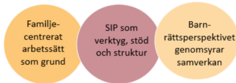
Bild: Temagrupp barn och ungas samverkansplattform

Temagrupp Barn och unga har utvecklat en samverkansplattform att arbeta utifrån. Det familjecentrerade arbetssättet är grunden för arbetet. SIP används som verktyg, stöd och struktur. Barnrättsperspektivet ska genomsyra samverkan på alla nivåer. Målet är att alla barn ska lyckas i skolan.