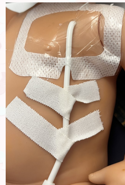
Exempel på plåster och tejpning.

Prata med vårdpersonal eller din kontakt/konsultsjuksköterska för mer information om vad som gäller för just dig.