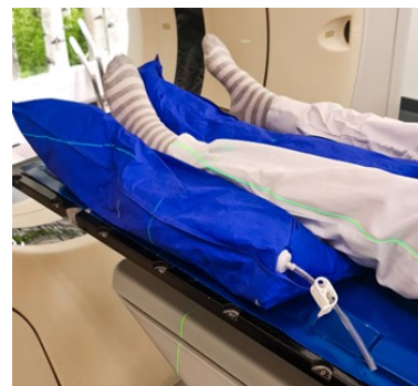
Ben i formad kudde.