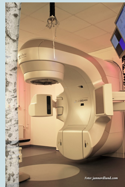
Strålarapparat. Privat bild.