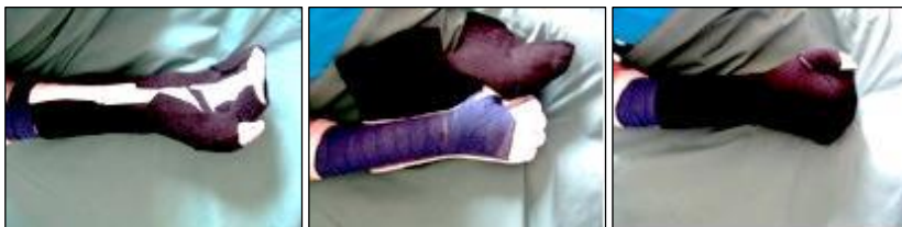
Exempel på hur en ortos kan se ut

Ortos: På morgonen dagen efter operationen tillverkar vi en individuellt anpassad ortos (skena) för din arm/hand. Ortosen ska du ha på dygnet runt de 3 första veckorna, den får bara tas av vid rörelseträning. När det har gått 3 veckor ska du fortsätta ha ortosen nattetid tills det gått minst 3 månader sedan operationen. Nedan ser du ett exempel på hur ortosen kan se ut. Tänk på att ta med kläder med vida ärmar som går att få över ortosen.