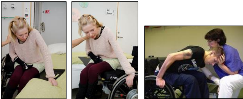
Tekniker för förflyttning till/från rullstol

Bilkörning: Om du normalt brukar köra bil i vardagen behöver du förbereda dig på att det inte är tillåtet att köra bil de första 8 veckorna efter operationen. Denna tid kan variera något beroende på typ av operation.