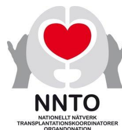
Figur 4 logga NNTO

Kerstin Karud, medredaktör i de två första versionerna av Nationella donationspärmen