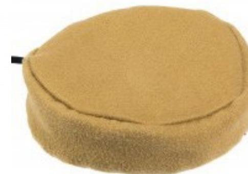
Pillow case switch

De larmknappar/manöverknappar som listas ovan är bara ett axplock av de som är upphandlade.