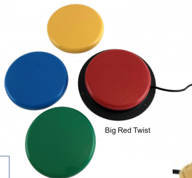
Big Red Twist