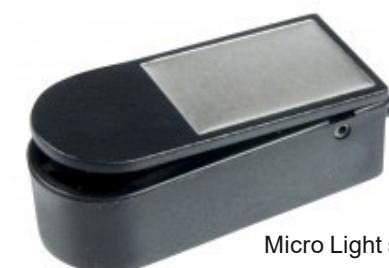
Micro Light switch