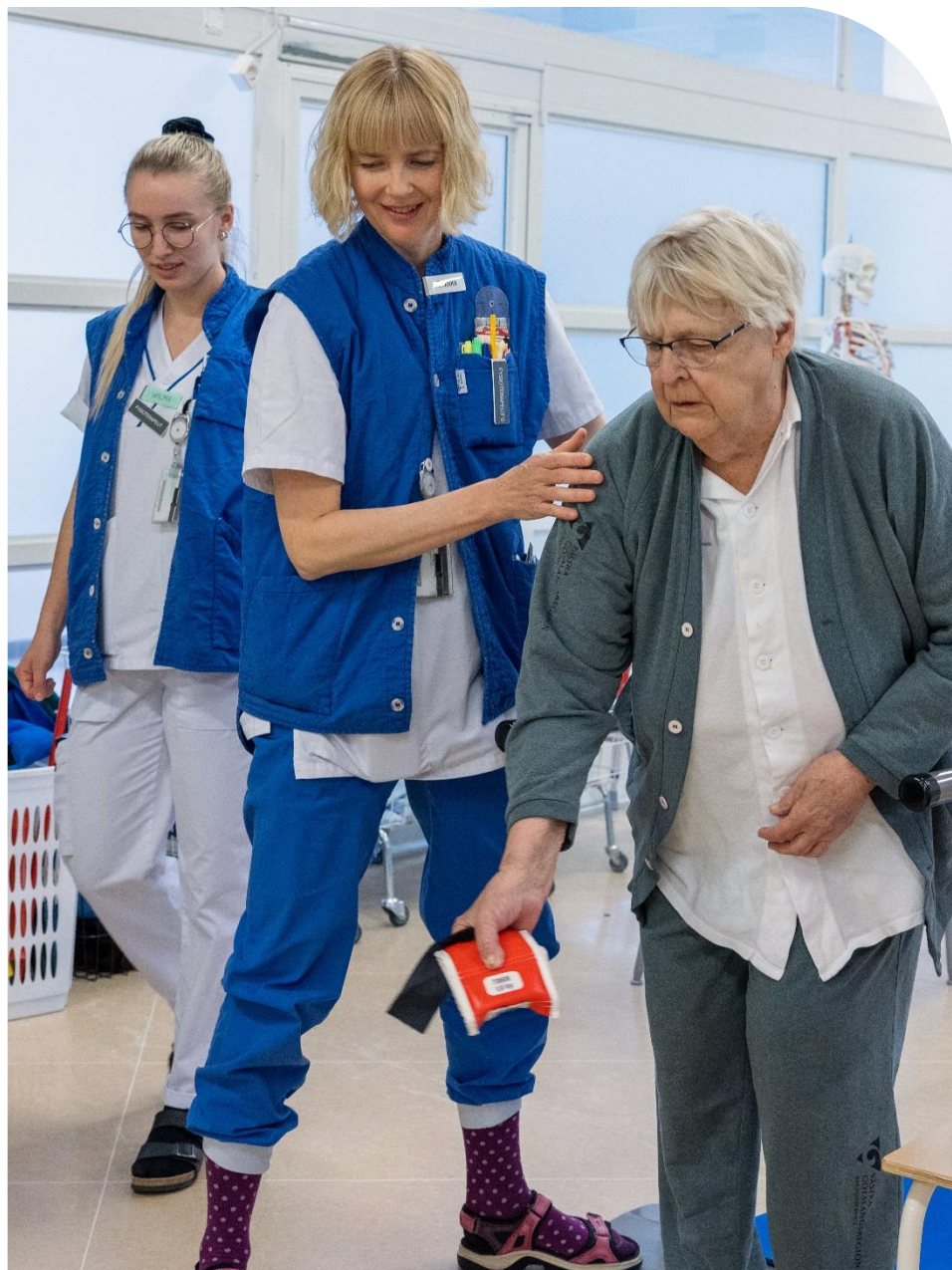
Version 1, 2025-02-21 Tryck: VGR18738