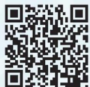
Antistress app (Android)