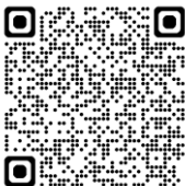
Ljudfiler avslappnings- övningar