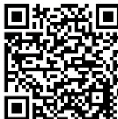
Mindfulness - medveten närvaro