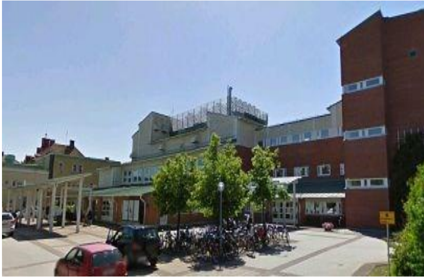
Sahlgrenska/ Mölndals huvudentré