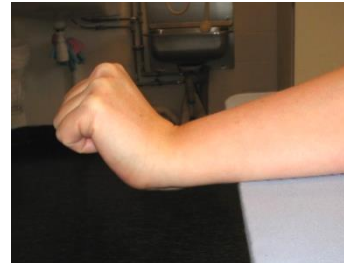
Sträck i handled