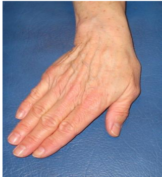
Vrid handen åt lillfinger