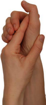
Böj och sträck i tummens ytterled

Instruktion: Gör programmet 4-5 ..... tillfällen/dag 5-10 gånger.