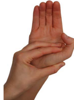
Böj och sträck i tummens mellanhand