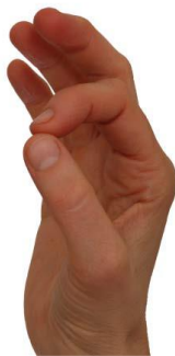
För tummen mot pek-, långfinger. Sträck ut mellan varje rörelse.