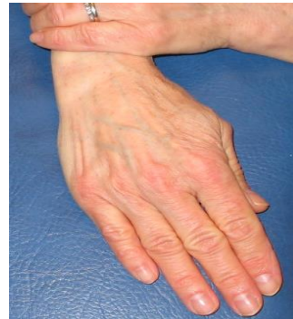
Vrid handen åt tumsidan