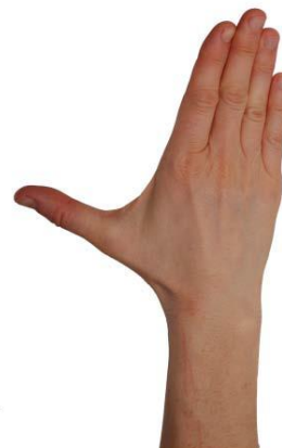
Handflatan mot bordet. För tummen utifrån pekfingret och tillbaka.