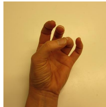
För tummen mot ring- och lillfinger. Sträck ut mellan varje rörelse