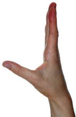
Lillfingersidan mot bordet. För tummen utifrån pekfingret och tillbaka.