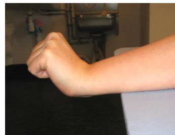
Sträck i handled