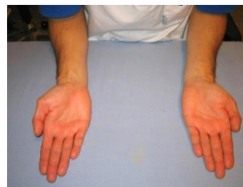
Försiktig rotation av underarm