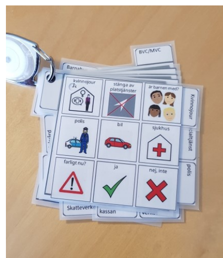
Så här ser den färdiga knippan ut