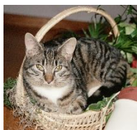
Vår katt Busen