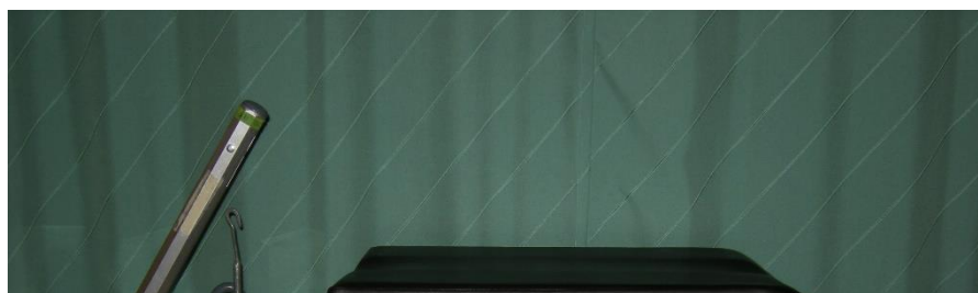
Detta skall finnas i ortoped smutten. Svarta kudden läggs i patientens säng.