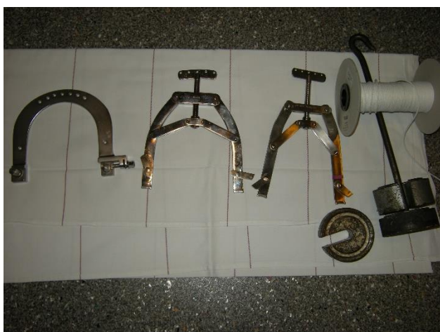
Finns i "Ortopedsmutten blå sida"