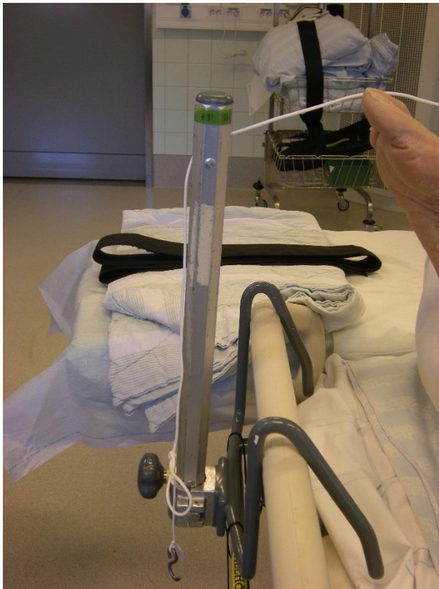
Pinne med trissa och hållare för sänggaveln finns i ortopedsmutten.