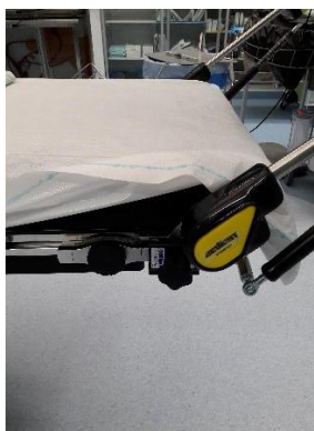
Benstöd på plats