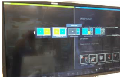
Olika layout visas på "largedisplay"