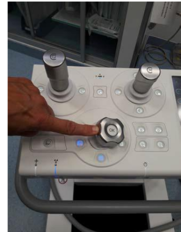
Välj layout. Markera ENDO 1. Tryck OK