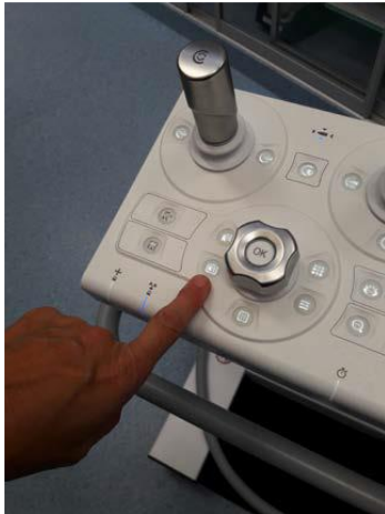
Tryck. Knappen blir blå.

Aktivera önskad layout på trolly om skopibild önskas på bildskärmar till ARTISpheno