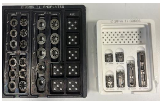
Implantat 20 mm