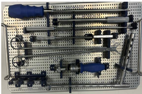
20 mm instrument