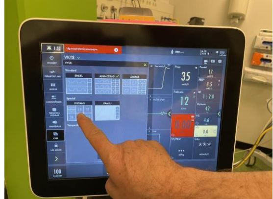
Tryck på "Distans"