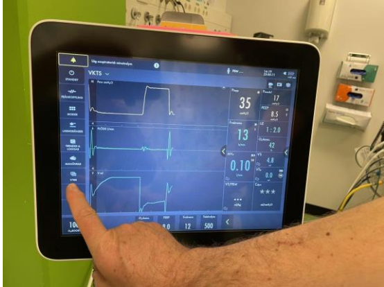
Tryck på vy knappen på sidan.