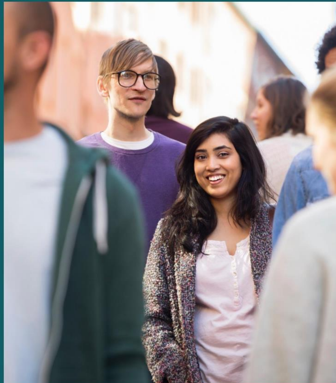
Fokus för överenskommelsen är strategiskt arbete, förebyggande insatser till barn och unga, insatser vid komplexa behov och suicidprevention