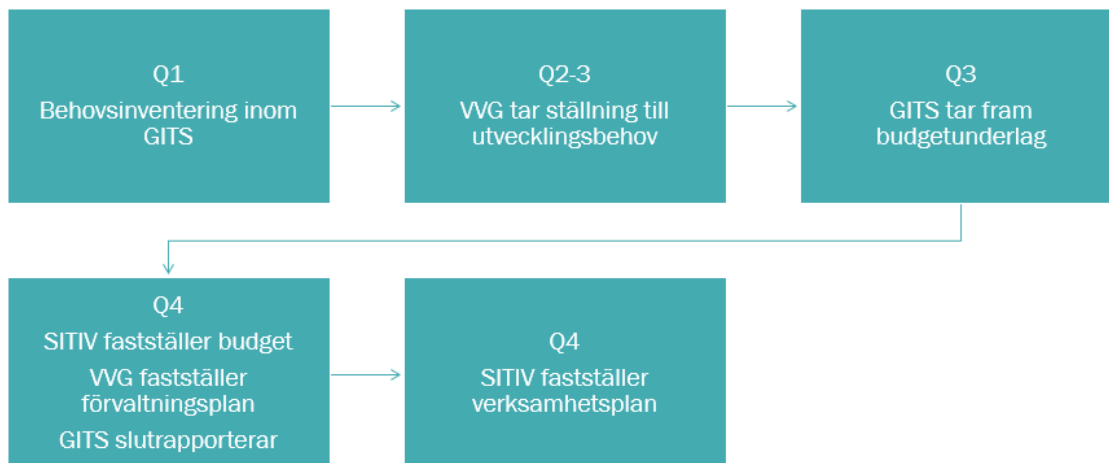
Figur: Förvaltningsmodellen i processform