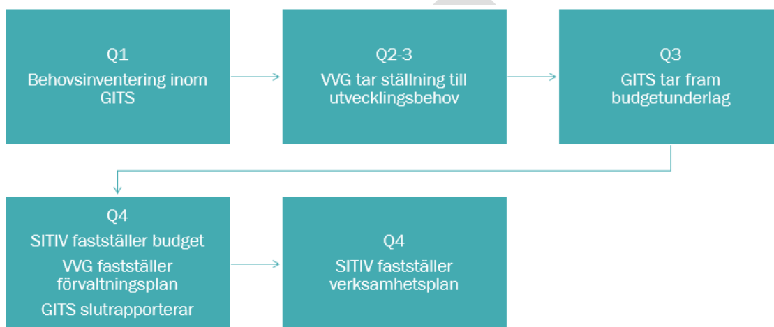
Figur: Förvaltningsmodellen i processform

Uppdrag utöver beslutad förvaltningsplan och budget ska förankras med styrgrupp och finansiär.