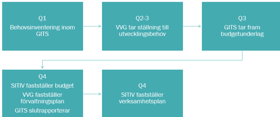
Figur: Förvaltningsmodellen i processform