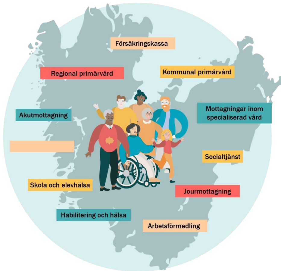
Bild 2 Behov av att säkerställa vårdövergångar mellan öppenvård kan identifieras på sjukhusens öppenvårdsmottagningar, i regionens primärvård och i den kommunala primärvården, samt inom socialtjänst.

Det finns inget som hindrar att andra berörda bjuds in i öppenvårdsprocessen. Det är till exempel skola och elevhälsa, Försäkringskassa, Arbetsförmedling, Statens institutionsstyrelse, SiS eller andra som är involverade och som den enskilde önskar ha med.