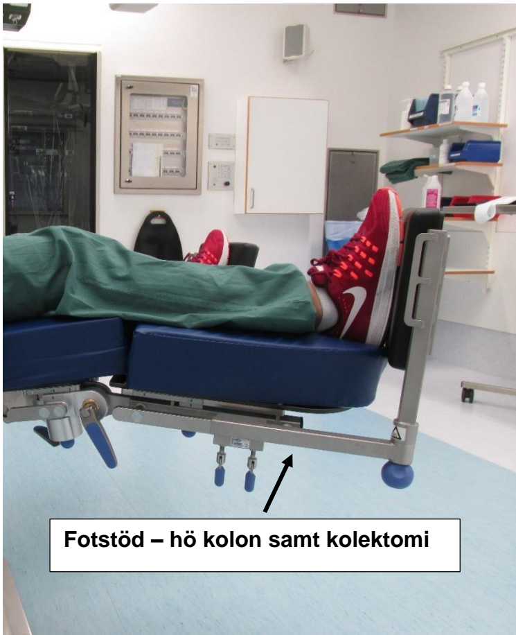
Fotstöd – hö kolon samt kolektomi