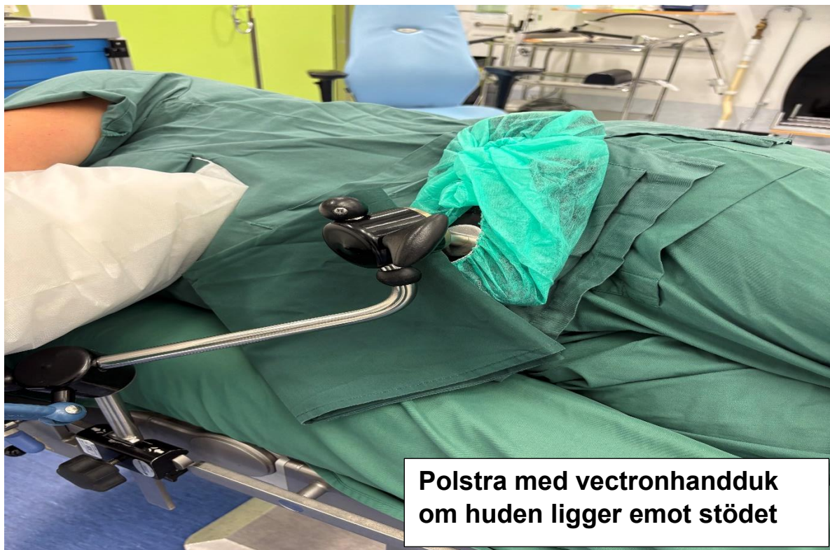
Polstra med vectronhandduk om huden ligger emot stödet