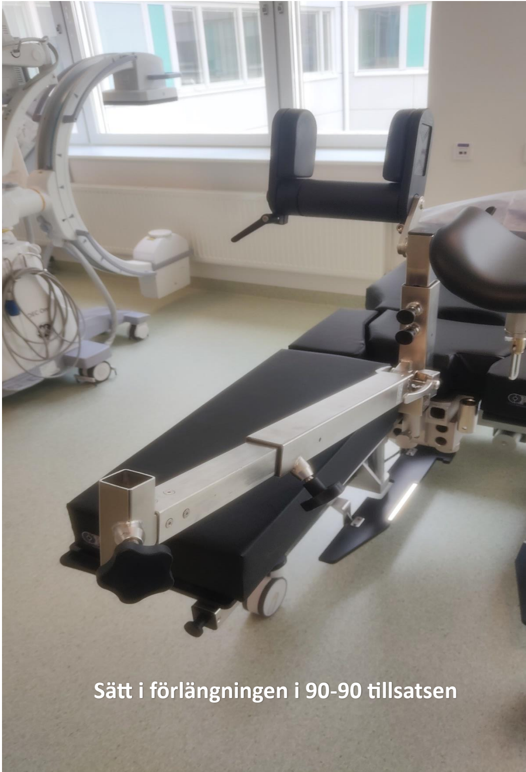
Sätt i förlängningen i 90-90 tillsatsen