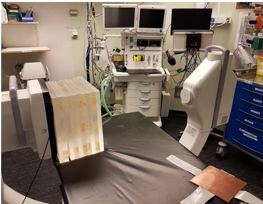
Figur 2: Denna uppställning används för att kontrollera tjocklekskompensation

Avvikelsen mellan enskilda mätvärden och medelvärdet bör, enligt IAEA-rapporten, hamna inom \pm 40\% .