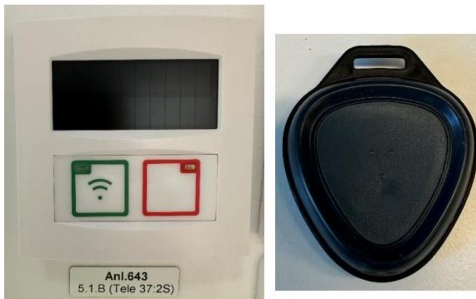
Larmsystem som aktiveras när du enbart trycker på bråklarmsknappen

Vid aktivering av bråklarmet går det ut ett larm till den egna enheten där det kommer stå i "larmdisplayen" var larmet är aktiverat samt att larmet går till Securitas.