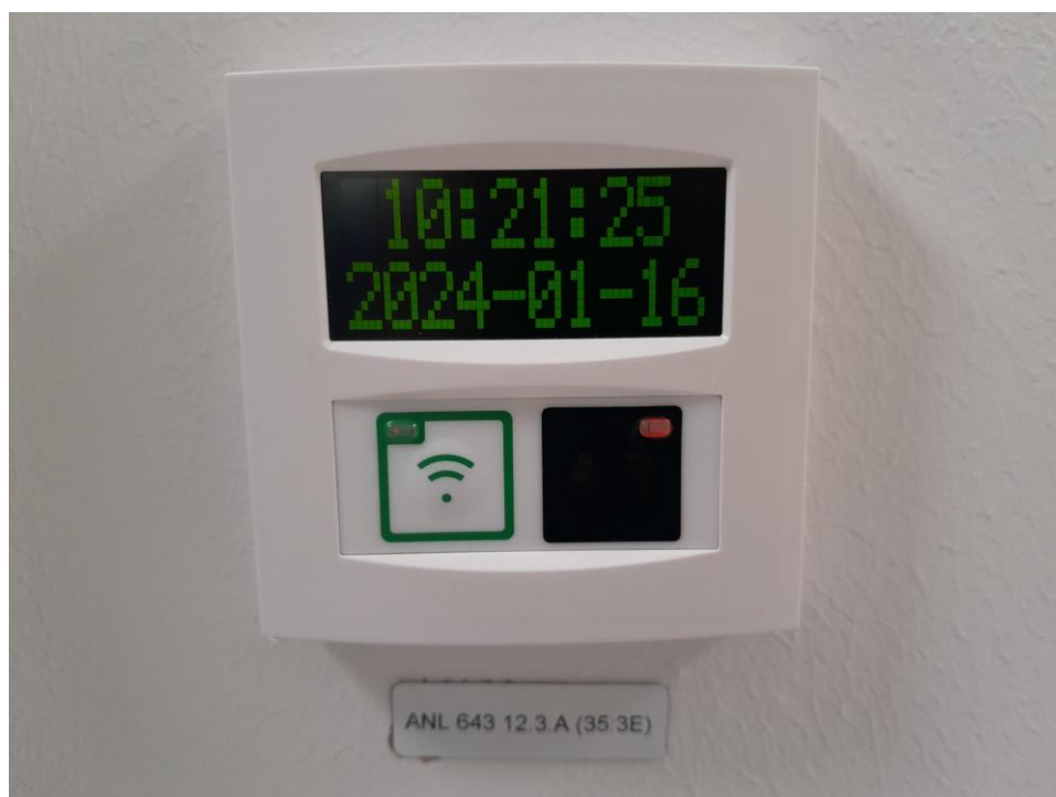
Larmsystem som man kan aktivera genom att man trycker på den svarta knappen på larmsystemet.

Vid aktivering av bråklarmet går det ut ett larm till den egna enheten där det kommer stå i "larmdisplayen" var larmet är aktiverat samt att larmet går till Securitas.