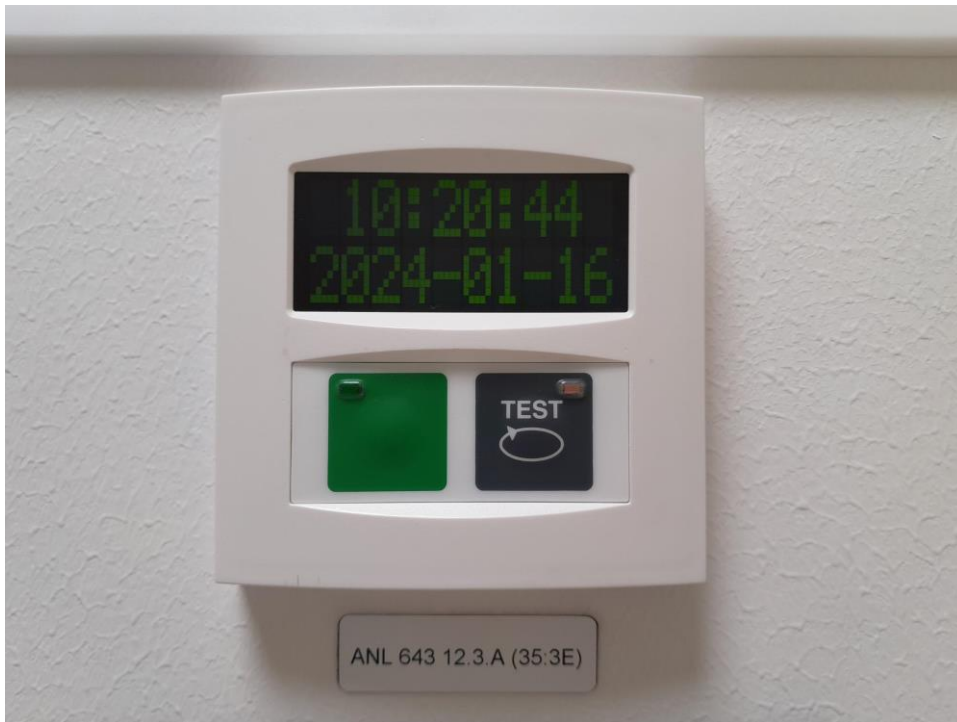
Teststation (aktivera bråklarmet)