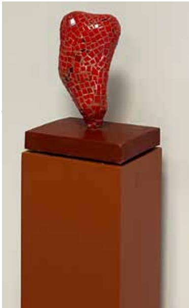
Konstnär: Britt-Marie Jern