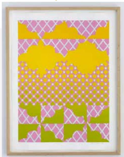
Konstnär: Marie Rantanen

grönt och silver, ett personligt färgspel som präglar konstnären Mari Rantanens konst. Former och strukturer är i dialog i ett kontrollerat måleri och konstnären hämtar inspiration från konsthistorien, populärkultur, arkitekturdetaljer och vardagen. Ljuset, kontrasten och relationen mellan kaos och ordning är viktig. Konstnären vill skapa en öppenhet i sin konst, där var och en tillåts hitta sin egen väg in i målningarna, och finna vila i dem.