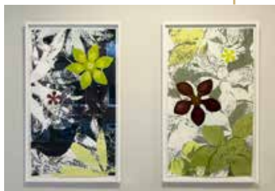
Konstnär: Catharina Warme Hellström

Koltrastblues 1, Vindens öga, Frostfjäril 1 och Frostfjäril 2 är fyra grafiska konstverk som skildrar växtkraft och former i naturen. Konstnären Catharina Warme Hellström kombinerar realistiska mönster med stiliserade och poetiska inslag i sina bilder. Bland stora blommor och blad tittar en koltrast fram, och bakom fjärilarna anar vi stugor med snickarglädje. Naturen är återkommande i konstnärens bilder som återfinns i olika skalor i många offentliga miljöer runt om i Sverige.