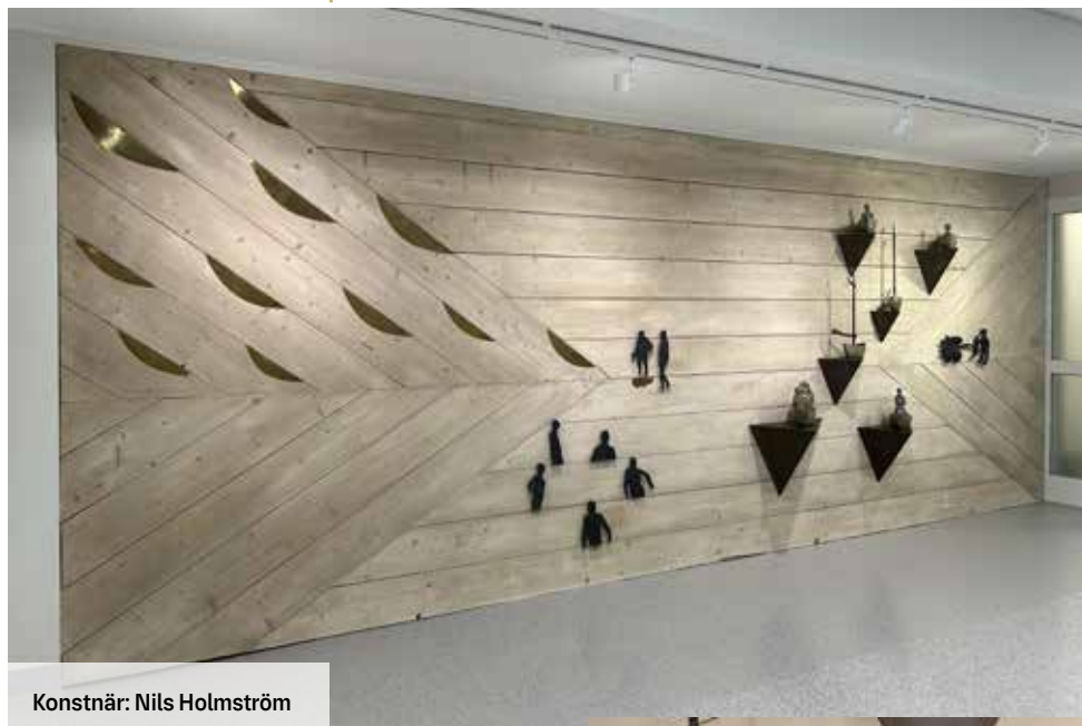
Konstnär: Nils Holmström