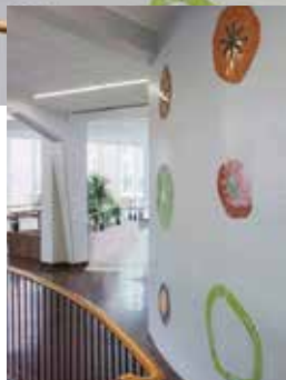
Konstnär: Bibbi Forsman

1 Okända djur är en stor mosaik från 2009 med färgglada figurer som vänligt välkomnar besökare och personal i sjukhusets entré. Konstverket består av nitton former i högbränt stengods och mosaik, infattade i kakel-mosaik. Konstnären Bibbi Forsman har skapat en taktil yta som kan upplevas från olika avstånd. Motivet associerar hon till olika livsformer, celler, växande och uppbyggnad. Hon har inspirerats av sådant som kanske bara kan upplevas i mikroskop och konstverkets titel Okända djur är hämtat från Beppe Wolgers sång. De olika formernas cirklar och ellipser i konstverket samspelar med designelement i miljön och tillsammans skapar de en helhetskänsla i sjukhusets entré.