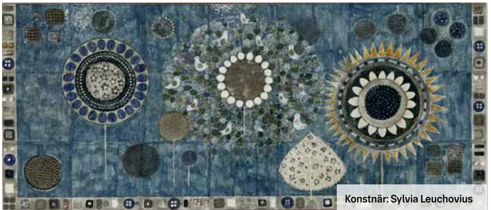
Konstnär: Sylvia Leuchovius