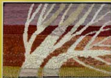
Konstnär: Gerd Allert

Första frosten är ett vävt, textilt konstverk i toner av en solnedgång. De stilla rörelserna och de olika texturerna skapar en varm och mjuk känsla, i kontrast till titeln. Konstnären Gerd Allert arbetade poetiskt med sina vävar. Tekniken hjälpte henne att föra över tankar, känslor och stämningar till betraktaren. Hennes konst återfinns ofta på platser som kyrkor och andaktsrum, där bilderna kan ge vila, tröst och kraft.