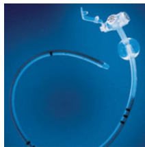
Mic-Kej Gastrojejunal knapp

Gastrotubvarianten har också två olika ingångar en till tunntarmen och en till magsäcken. Till gastrojejunal gastrotub behövs adaptrar, förskrivs av sjuksköterska. Båda varianterna har en kuffingång.