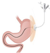
Mic-transgastrisk jejunal tub