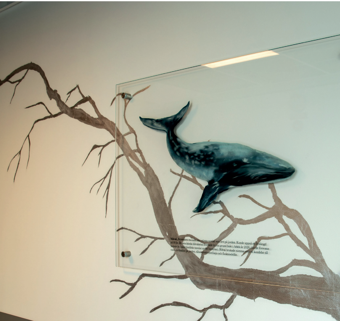
Konstnär: Johannes Heldén

Konstenheten, som är en del av Västfastigheter, arbetar med konstnärliga gestaltningsuppdrag i Västra Götalandsregionens offentliga miljöer, vilka ofta återfinns i vårdmiljö. Konsten tillför en estetisk, poetisk och existentiell dimension i människors liv och påverkar oss på olika sätt, både sinnligt och rumsligt.