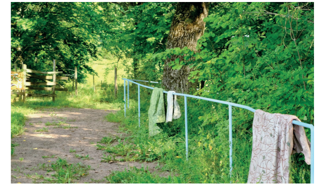
Konstnär: Roland Persson

3 Mönster i naturen är korgar med textilier och ett ljusblått räcke, som på sina ställen draperas av ornamenterade tyger som står vid entréerna till skogsparken. Dessa föremål leder besökaren in i parken. Gestaltningen lyfter fram de olika materialens taktila egenskaper, samtidigt som alla verkets delar i själva verket tillverkats i gjuten aluminium som omsorgsfullt har målats. Relationen mellan konstverket och platsen står i centrum. Konstverket väcker tankar och öppnar upp för olika tolkningar genom lekfullhet och en vördnad för hantverket. Frågor ställs om vilka kopplingar som finns mellan det mänskliga görandet och naturen.