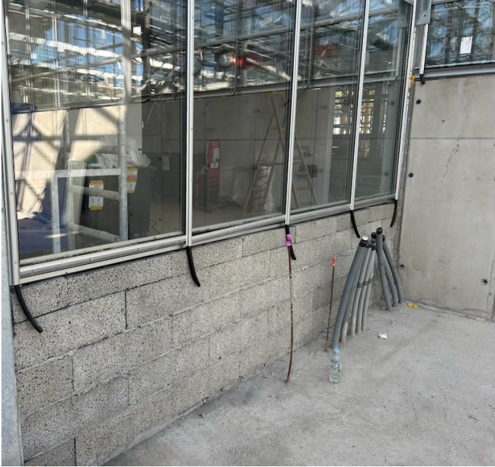
Figur 2. Murad lecasockel

Framöver kommer markarbeten fortsätta, samt installatörer som har fullt upp med att knyta ihop alla funktioner i växthuset.