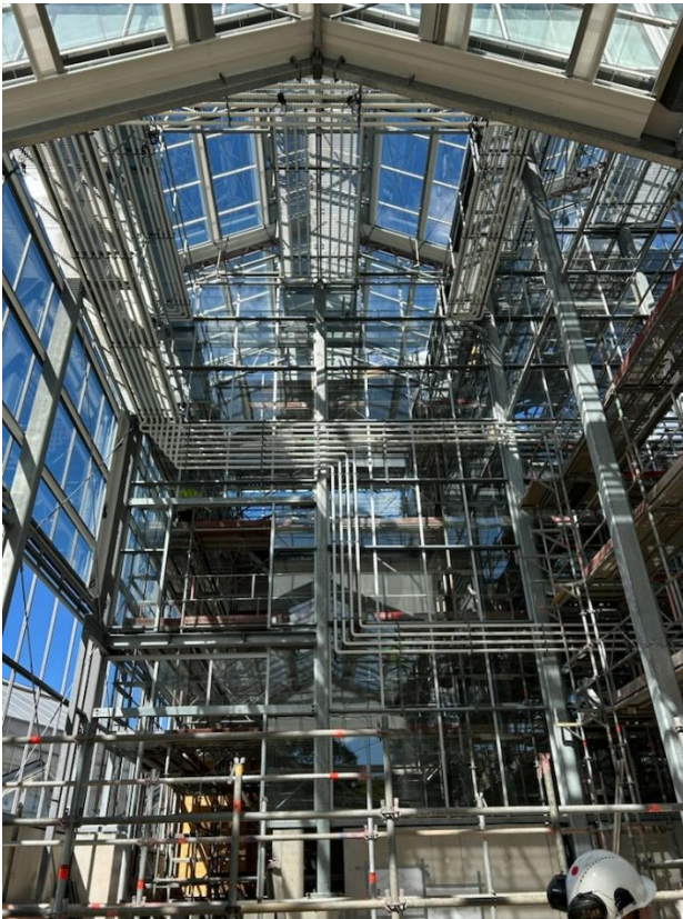
Figur 3. Värmerör på väggar och under servicebryggor