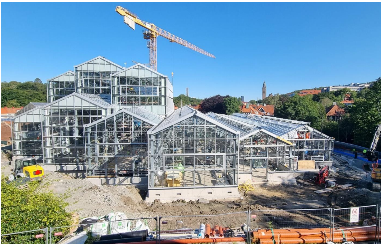
Figur 1. Vy från söder

Under semestern har kontorsdelarna fått massagolv, undertak och installationer. Plattsättning har startat i de rum som skall bekläs med keramiska plattor och plastmattor är lagda i installationsutrymmena på plan 3.