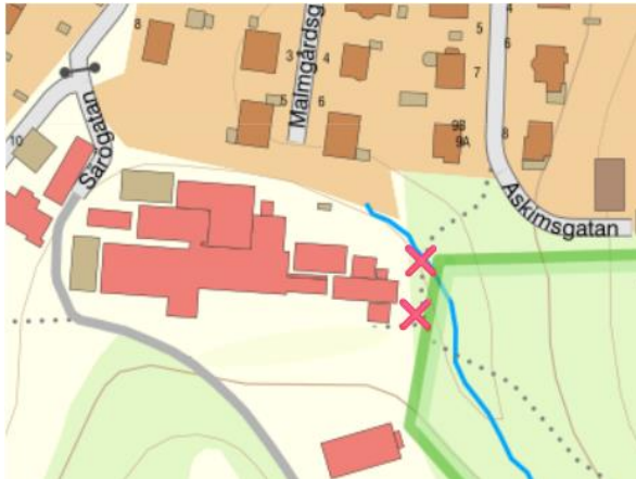
Figur 5. Översiktskarta avstängning stig Vitsippsdalen