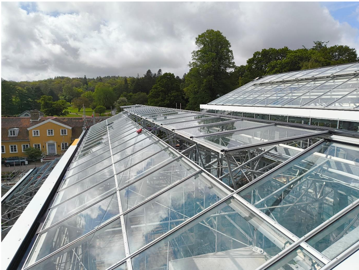
Växthustak med Stora Änggården och trädgården i fonden.

På växthuset monteras både glas och aluminium för att få det tätt, även vävar och diverse detaljer sätts på plats.