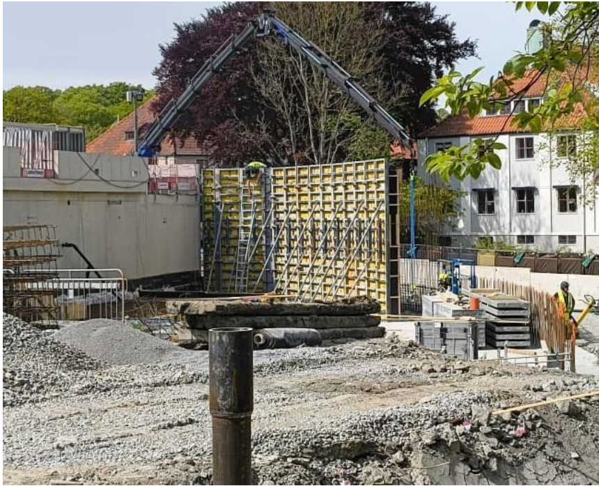
Figur 2. Förberedelse för kommande gjutning