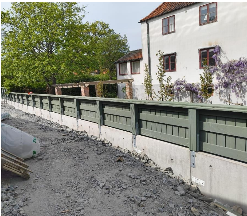
Figur 5. Plank västra sidan

Montage av plank mot grannar avslutas i veckan på västra sidan, det återstår målning. Montaget fortsätter ut mot östra sidan tills färdigt montage.