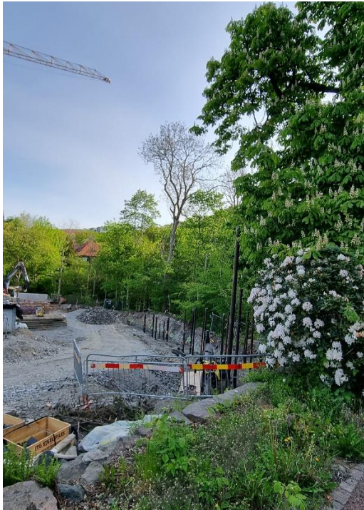
Figur 4. Pålur för kommande väg och gabionmur