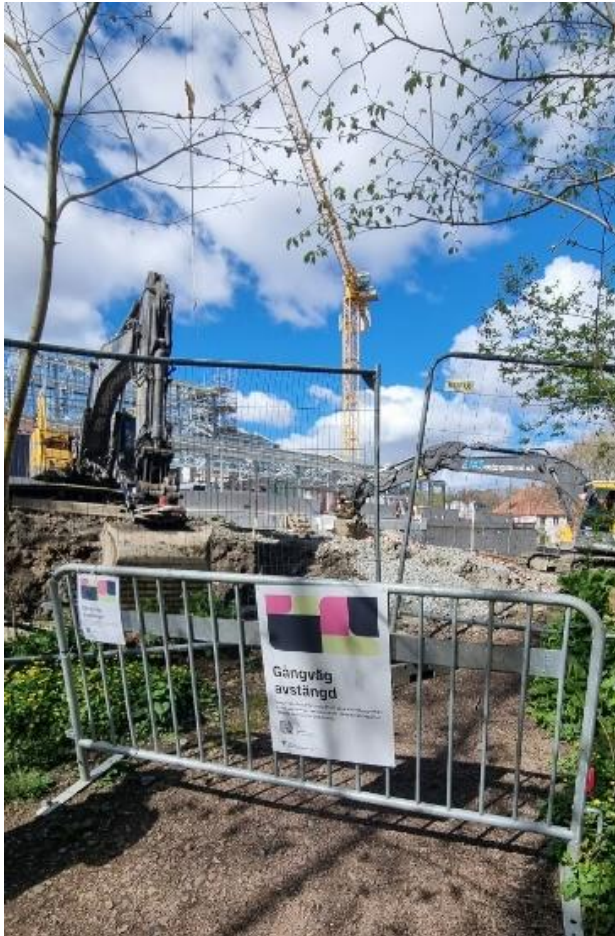
Figur 8. Avstängning stig vid entré Askimsgatan till Vitsippsdalen