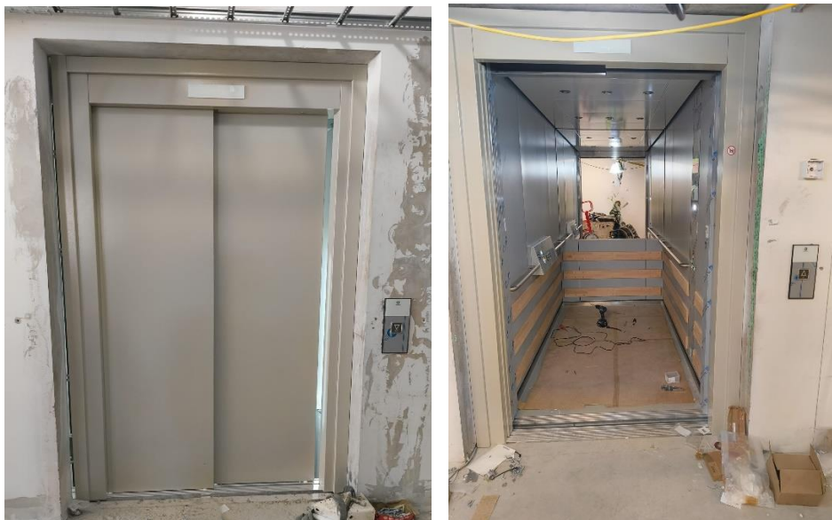
Figur 3. Färdigmonterad hiss