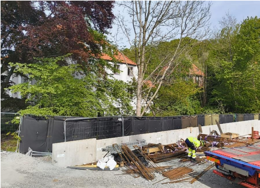
Figur 6. Montage L-stöd östra sidan