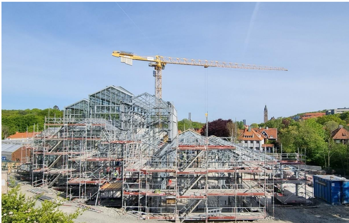
Figur 1. Översiktsbild arbetsområde etapp 2

Under de kommande veckorna fortsätter växthusentreprenören att montera glas, profiler och detaljer på växthuset. Det har även påbörjats montage av vävar invändigt i taket. Det har påbörjats montage av större installationer på plan 3 så som ventilationsaggregat och belysningscentraler. Installationsstråk på plan 2 pågår och plan 3 har precis startat. Det skall byggas färdigt väggar på plan 3, samt flytspackling av golv på plan 3. För att möjliggöra åtkomst till alla byggdelar har ställning monterats på flera stället i och runt växthuset.